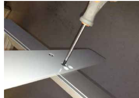
FüÙe unten anschrauben