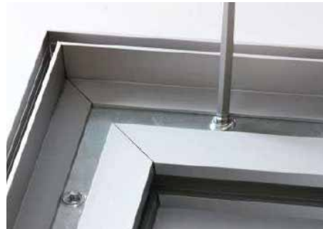
Schrauben mit Inbusschlüssel anziehen