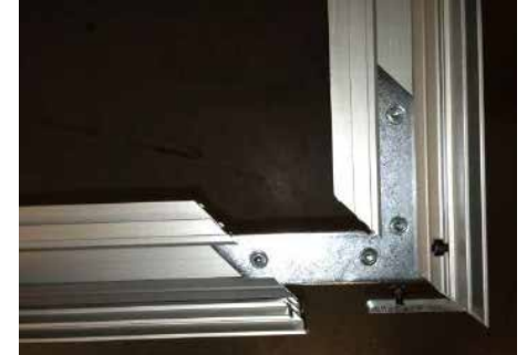
Zwei Eckverbinder übereinander in das Profil einschieben